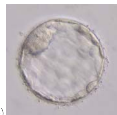
→●胚盤胞（採卵5日目前後）