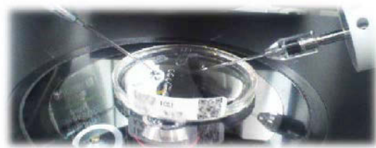
↑ 2次元バーコードリーダー（左）とQRコードの格納されたラベルが貼られたICSIディッシュ（右）。

このように、より厳格に「5 Rights」を満たす処置を実践できる体制を整えることで、これまで以上に安全かつ安心な治療を、みなさまにお届けすることが可能となりました。